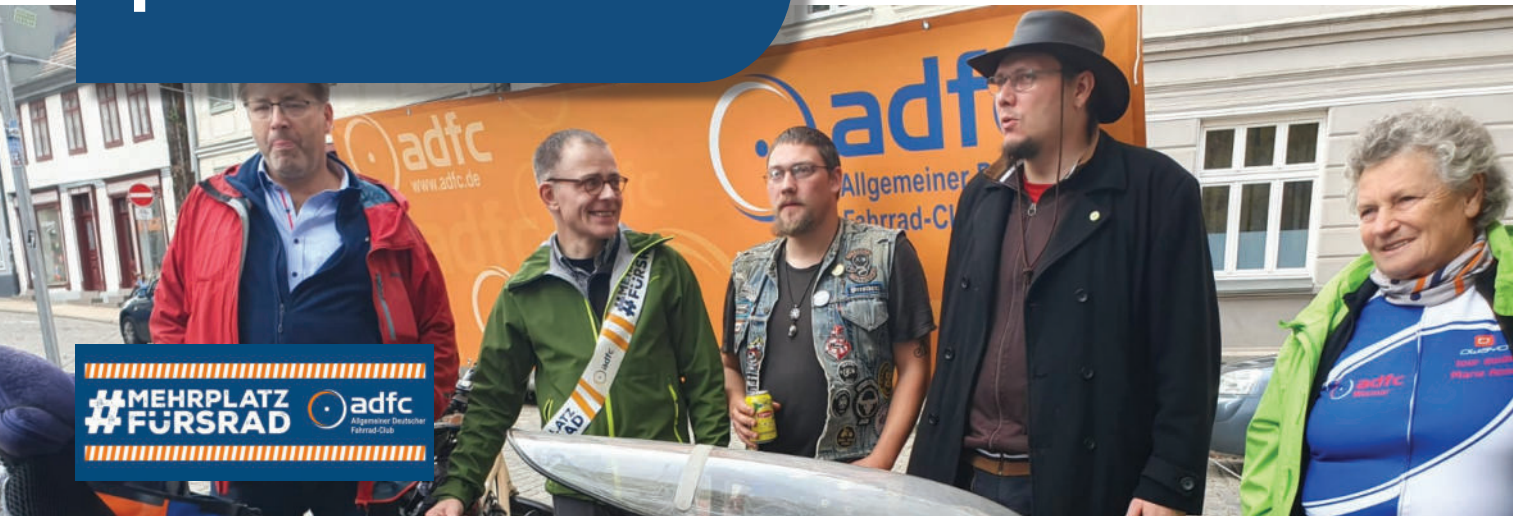
Eröffnung der Landesgeschäftsstelle und Demonstration #MEHRPLATZFÜRSRAD am 18.10. in Schwerin